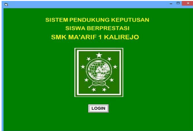
Gambar 2. Menu Utama

Form login ini merupakan awal dari pembukaan suatu program, dari form login ini maka akan masuk ke Menu Utama. Seperti Gambar 2 dibawah ini :