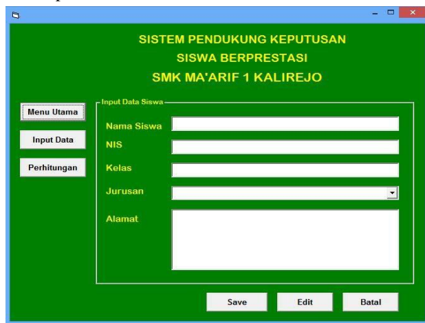
Gambar 3. Form Input Data Peserta Seleksi

Form ini digunakan untuk melakukan proses pemasukan data peserta seleksi berprestasi, seperti Gambar 3 dibawah ini :