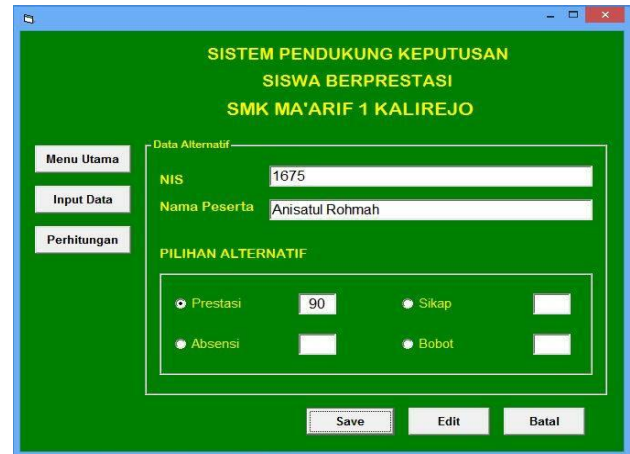
Gambar 4. Form Perhitungan dan Hasil Perhitungan

Form ini digunakan untuk menghitung sekaligus form hasil perhitungan kriteria-kriteria pemilihan siswa berprestasi, seperti peringkat, absensi, sikap dan bakat, seperti gambar 4 dibawah ini :